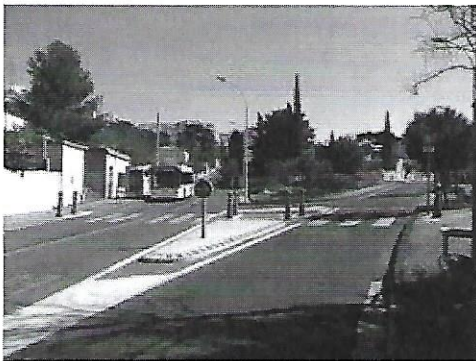
terminus bus RTM ligne 46s la panouse marseille 13009